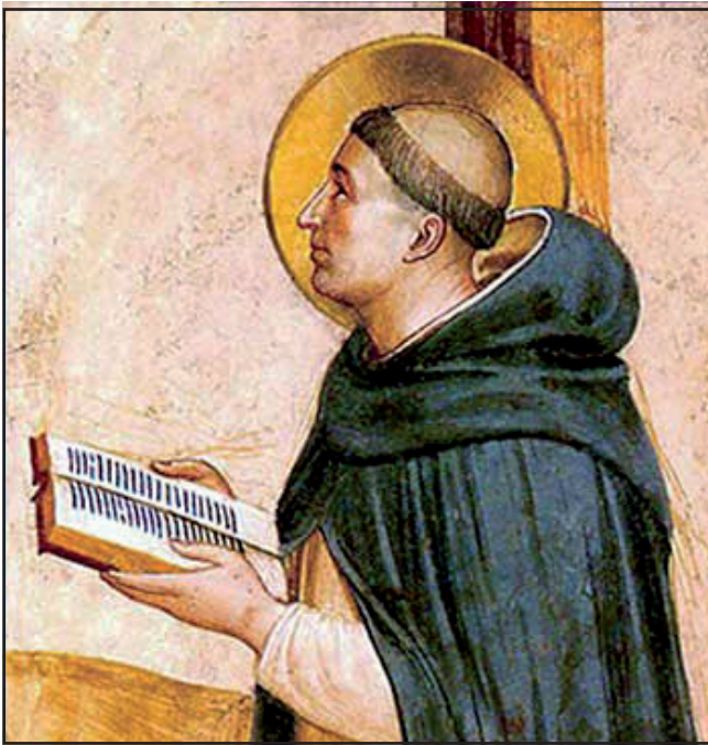
SANTO TOMÁS DE AQUINO

La soberbia es un pecado capital y es el principio de todo pecado, quien la tuviere será maldito siendo por ella derribado: Así dice el Eclesiástico, porque la soberbia es un deseo desordenado de la propia estima y honor de uno mismo, e implica, por tanto, un desprecio mayúsculo al resto de la gente y la sustitución de Dios por el amor a uno mismo. Como consecuencia este pecado trae a nuestra alma otros muchos pecados graves, por eso la soberbia es el más grande de los enemigos del alma. Este pecado fue el pecado de los Ángeles que se rebelaron contra Dios y fue la soberbia lo que transformó a Lucifer de ser un querubín ungido de Dios, una creación de perfección, lleno de sabiduría y dotado de hermosura, en Satanás, el diablo, el padre de la mentira y príncipe de las tinieblas; tal es el alcance de este terrible pecado capital.